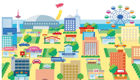
ホテル、テーマパーク